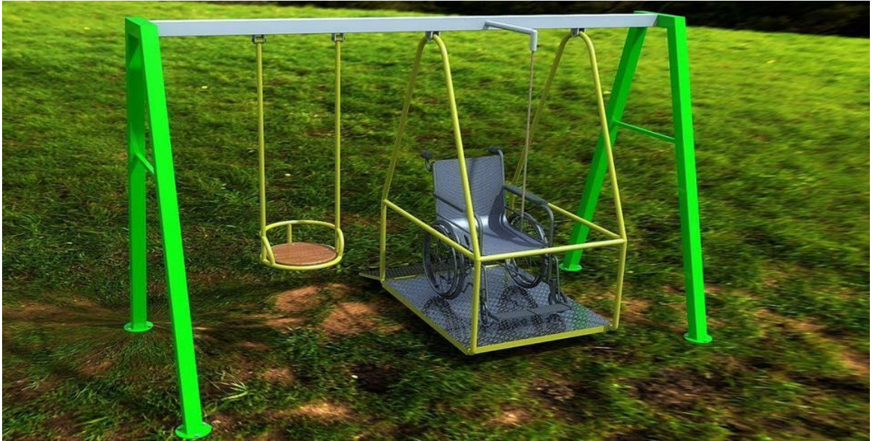
A swing for children with disabilities ( pic. 3)