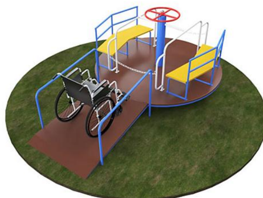
Игровой комплекс для детей с ограниченными возможностями (рис.5)